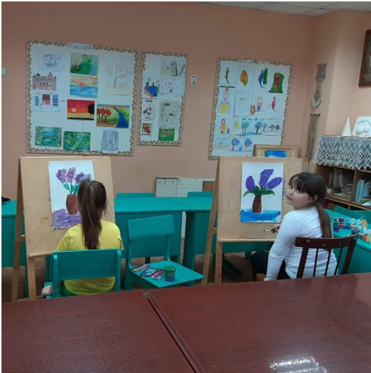
Занятие в кружке «Палитра»