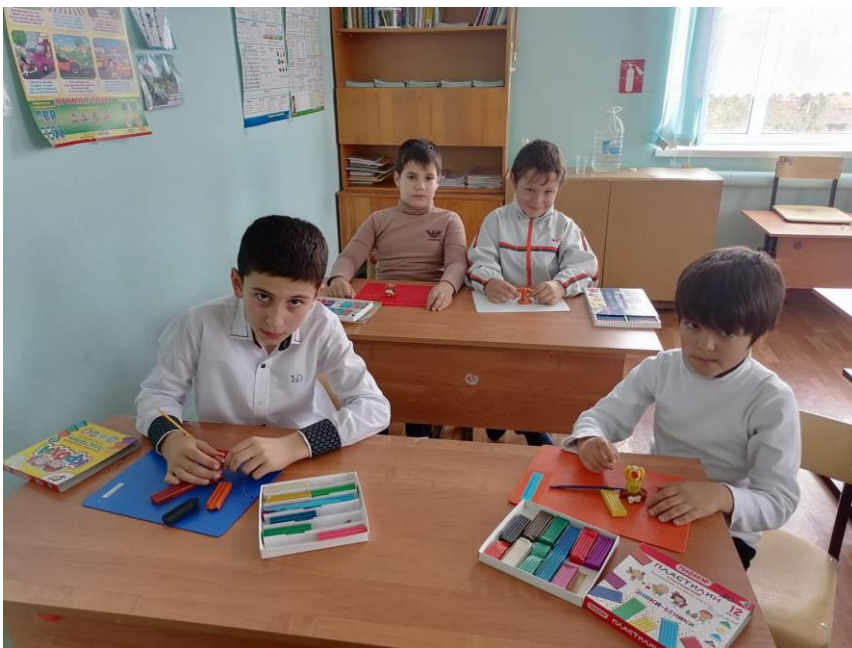
Кружок «Страна мастеров»